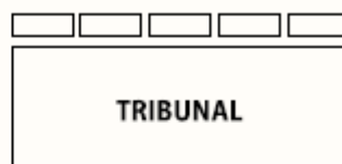
SEGUNDO DAN EN ADELANTE

IMPORTANTE: Estos diagramas de realización son aconsejables para la preparación de los distintos exámenes. Utilizando estas direcciones se pueden reflejar claramente todos los puntos importantes requeridos.